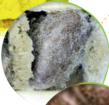
Kokon mit Puppe in der Brutzelle