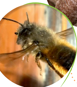
Rote Mauerbiene im Flug