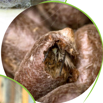
Rote Mauerbiene schlüpft aus dem Kokon